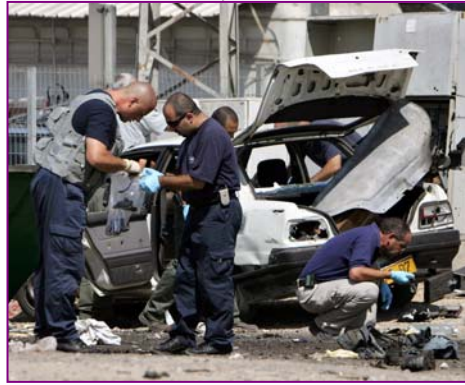
יירת הפיגוע לאחר פעולת ההתאבדות באזור התחנה המרכזית בבאר שבע